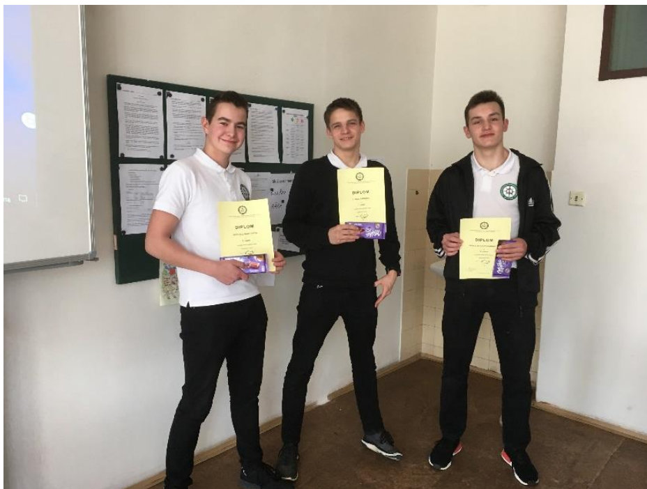
Školní vítězi matematického klovana