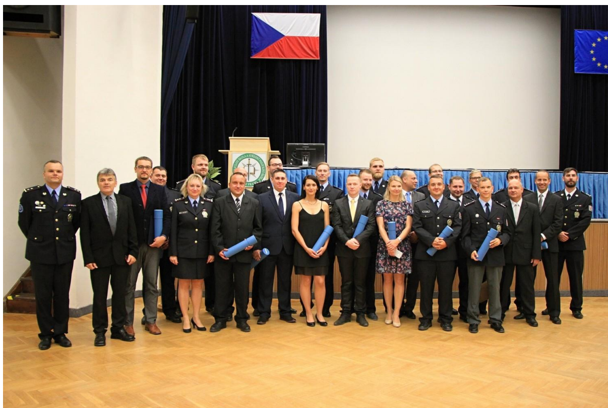
Slavnostní vyřazení absolventů studia VPŠ 8. června 2018