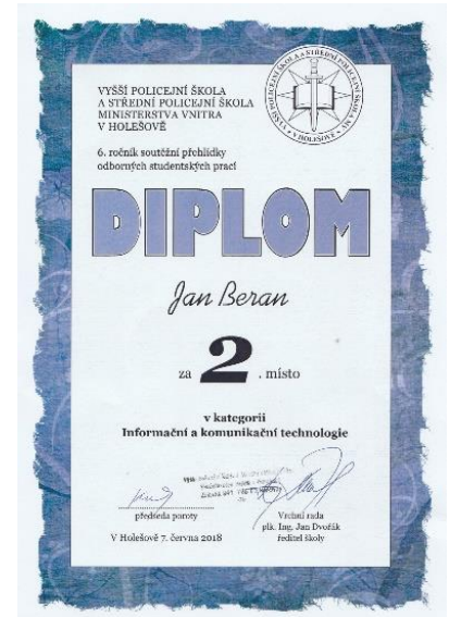
Diplom z přehlídky studentských prací v Holešově