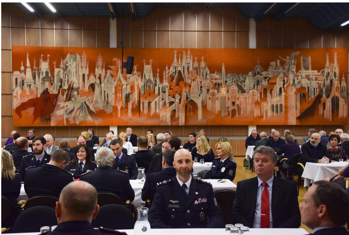
Den učitelů 28. 3. 2018