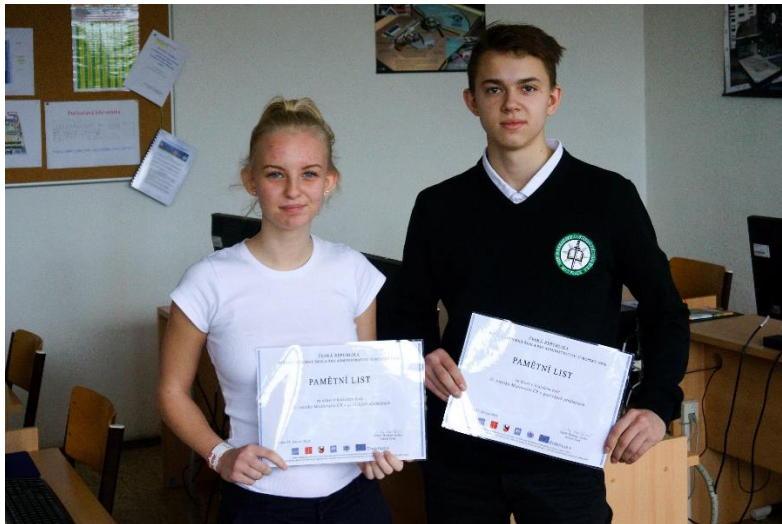
Školní kolo soutěže středních škol v psaní na PC klávesnici