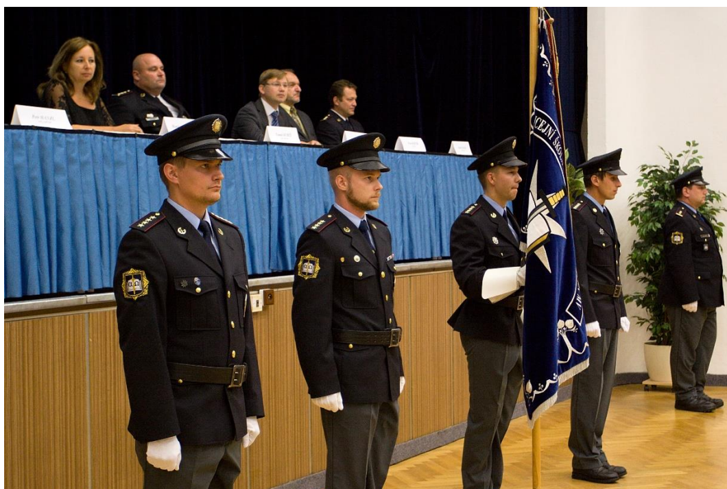
Zahájení školního roku