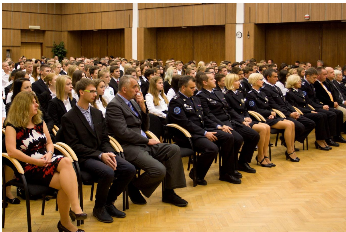
Zahájení školního roku 2017/2018