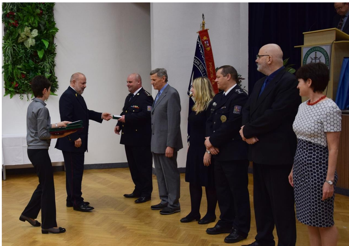
Den učitelů 28. 3. 2018