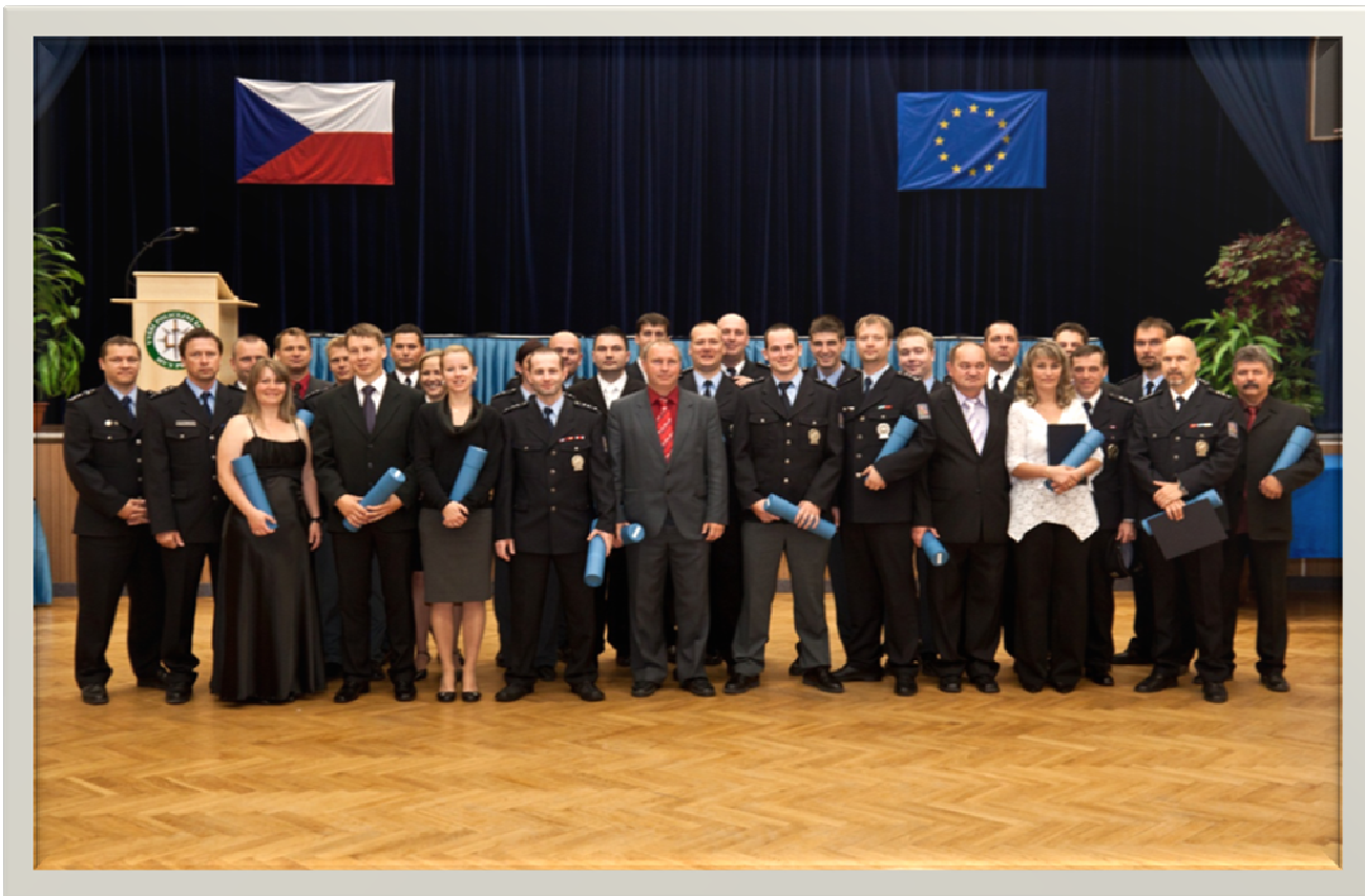
Absolventi třídy VPŠ/6