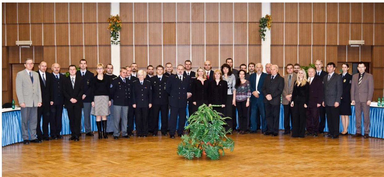
Účastníci V. mezinárodní vědecké konference

Z jednání konference byl zpracován sborník všech příspěvků jejích účastníků, který byl vydán v tištěné a elektronické verzi.