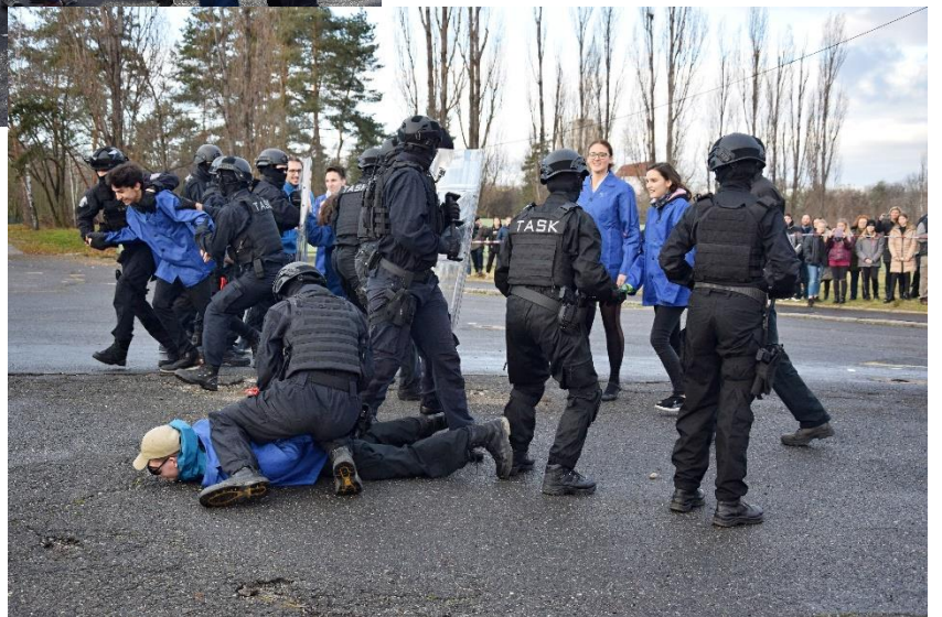
Ukázky ze dne otevřených dveří v prosinci 2019