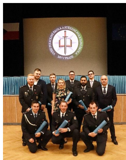
Slavnostní předávání maturitních vysvědčení žákům SPŠ a vyřazení absolventů VPŠ