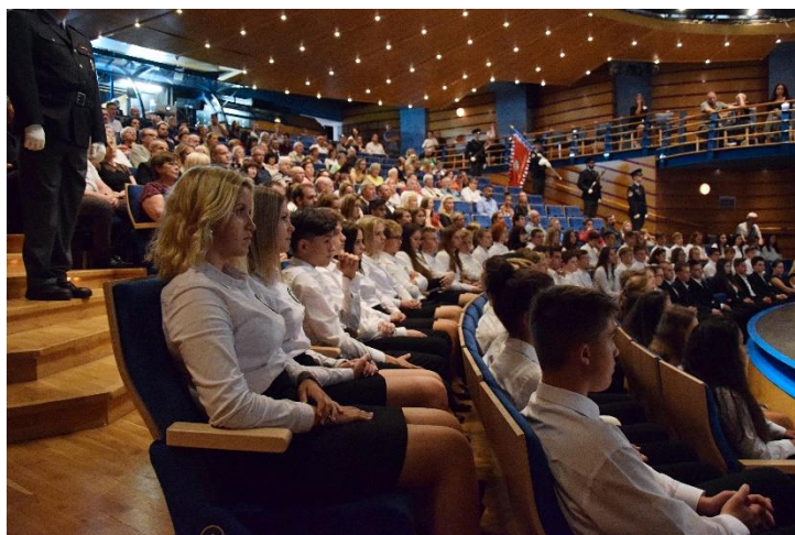
Slavnostní zahájení školního roku v Praze a v Sokolově