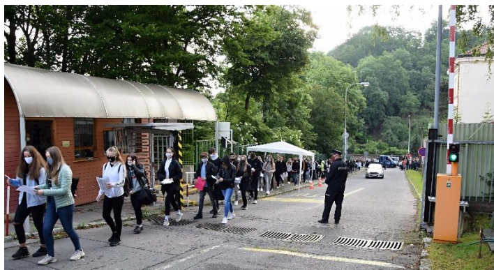
Uchazeči o střední policejní vzdělávání (tentokrát v rouškách)

Z přijatých žáků bylo 83 přijato do školy v Praze 9 - Hrdlořezích a 39 do odloučeného pracoviště středního policejního vzdělávání Sokolov.