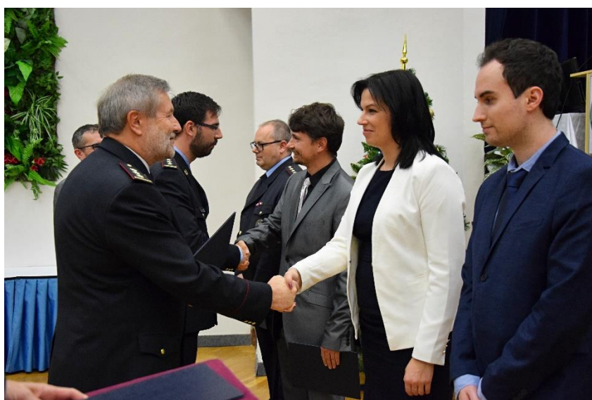
Předávání ocenění pracovníkům školy v rámci slavnostního vyhodnocení kalendářního roku