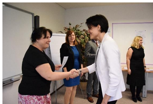
Závěrečná zkouška studia pedagogiky pro učitele (únor 2020)