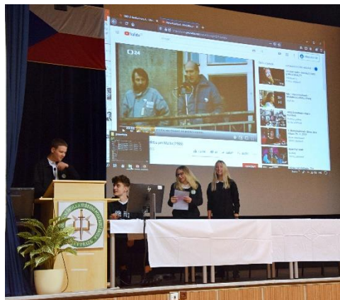
Krimifest v Březové 7. 11. 2019 a projektový den k výročí sametové revoluce 13. 11. 2019