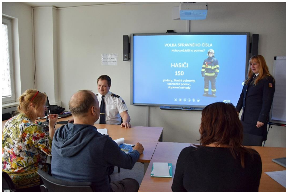
Kurz CJDV pro příslušníky HZS v prosinci 2019

Kromě prezenčních kurzů škola nabízí i e-learningové kurzy.