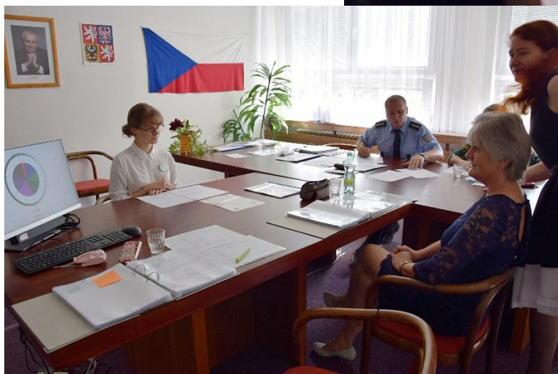
Průběh maturitní zkoušky v jarním zkušebním termínu