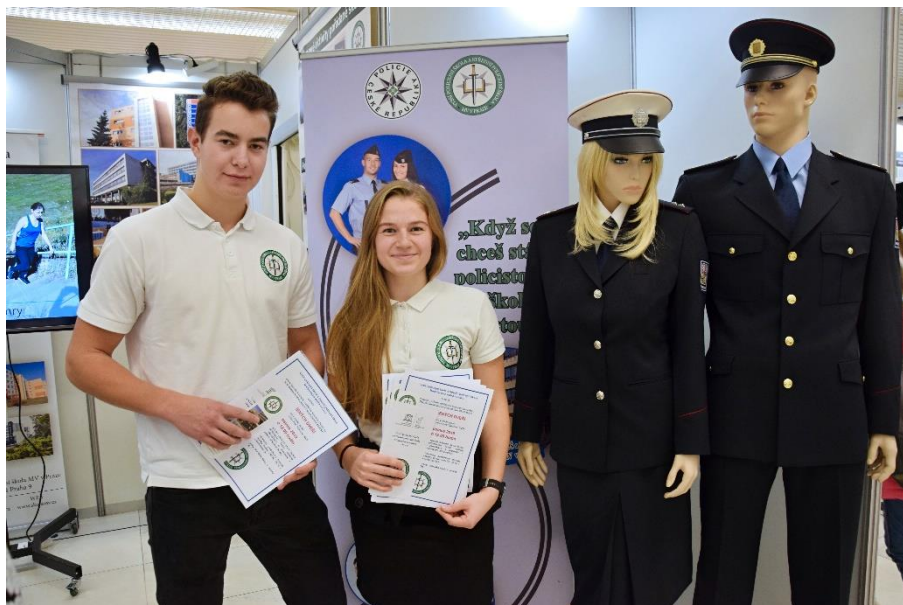
Účast žáků 3. A na Schole Pragensis v listopadu 2019