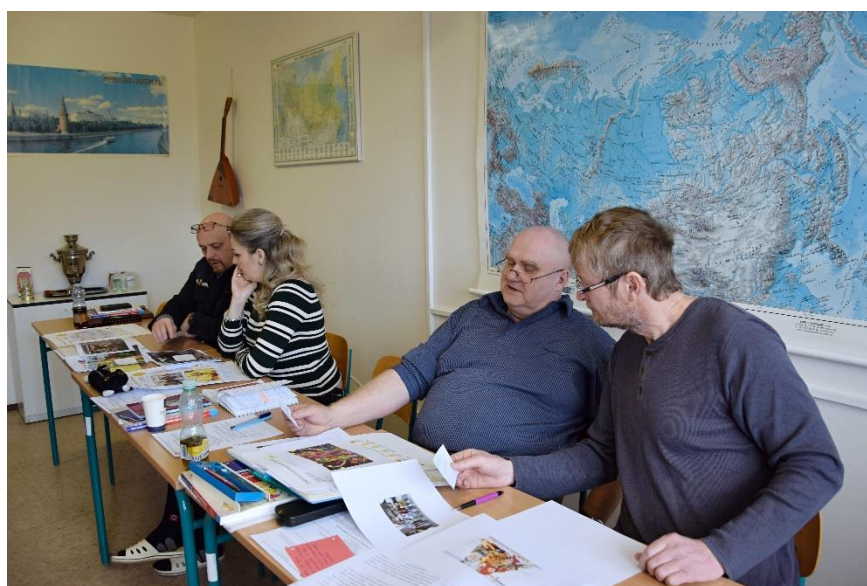
Výuka v Centru jazykového a dalšího vzdělávání